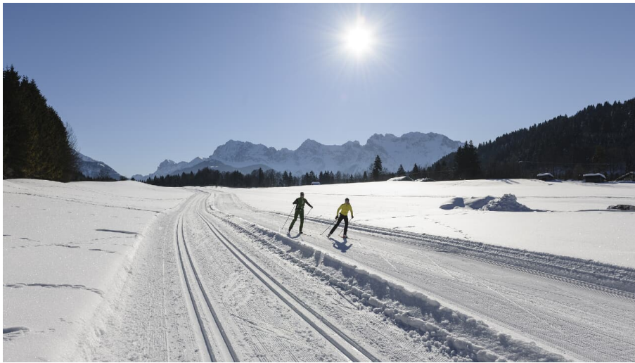
Die sportliche Loipe