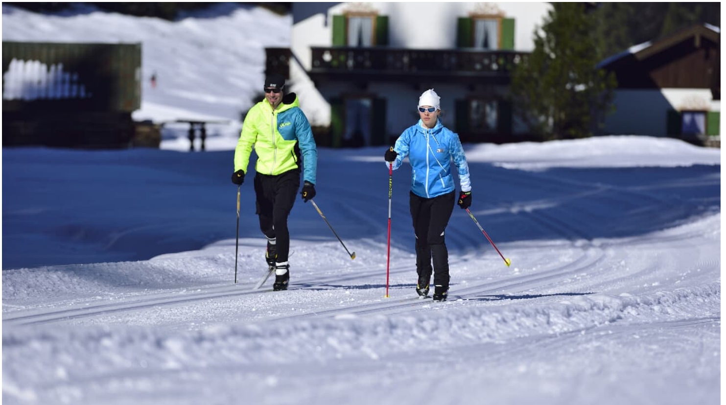
Klassisch Langlauf Klais