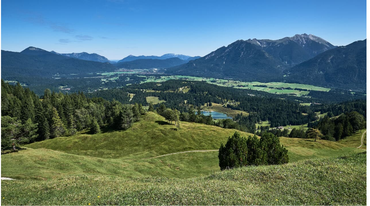
Kranzberg Panorma