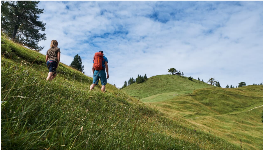
Familienwanderung am Kranzberg