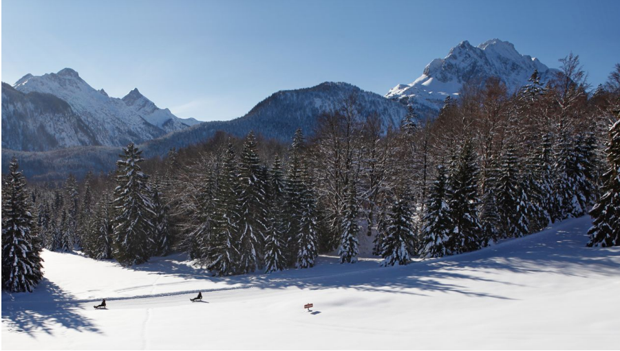
Naturrodelbahn Kranzberg