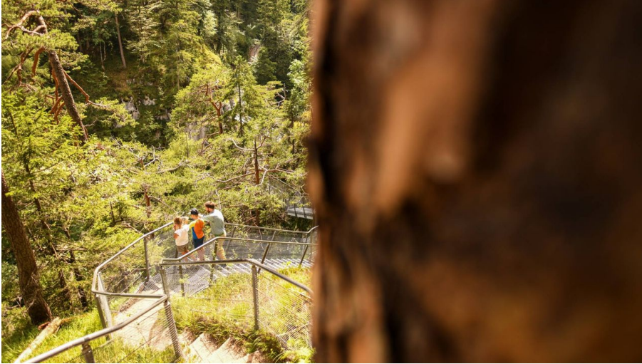
Unterwegs in der Leutascher Geisterklamm bei Mittenwald