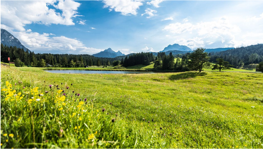
Auf dem Weg zur Goas-Alm vorbei am Schmalensee