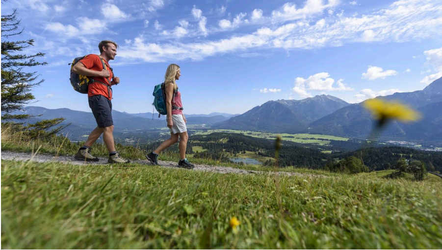
Kranzberg_wandern2_2764_3.jpg