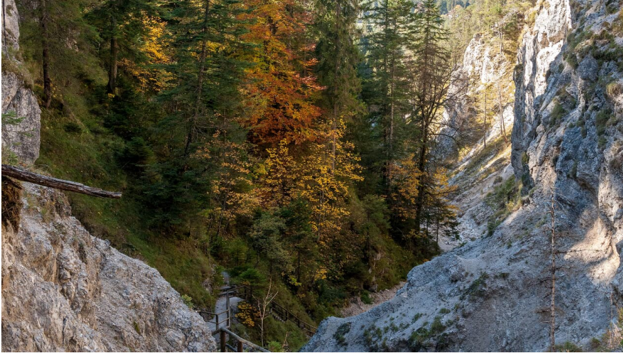
Durch die Hüttlebachklamm