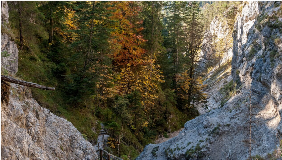
Durch die Hüttlebachklamm