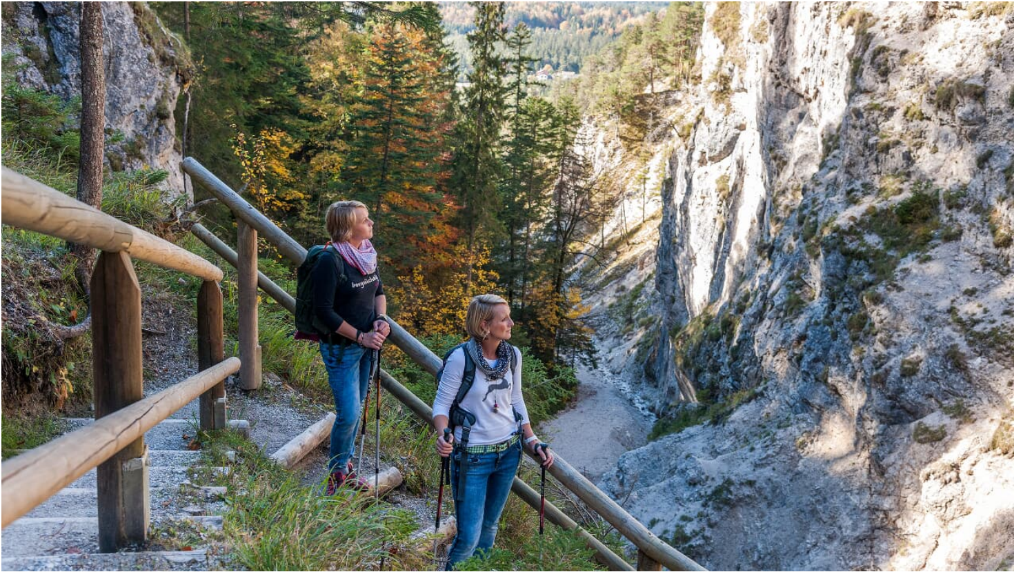
Wandern durch die Hüttlebachklamm