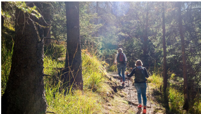
Wandern um Schwarzkopf