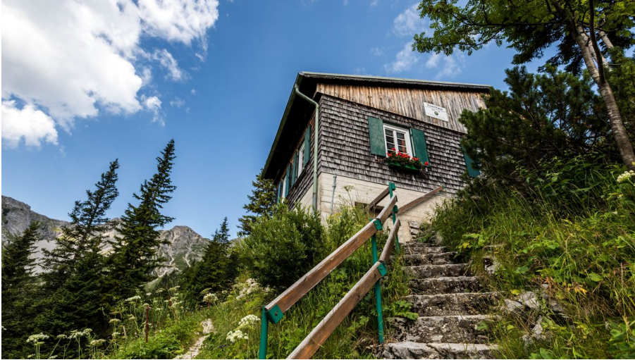
Soiernhaus bei Krün auf 1616m