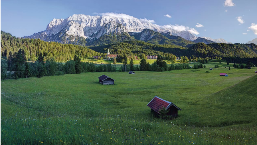
Schloss Elmau