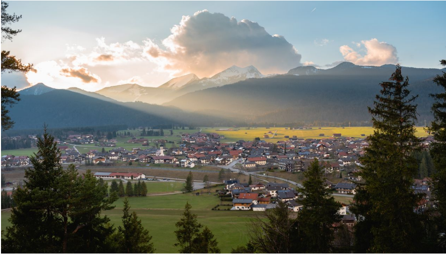
Karwendel-dk-11_8560.jpg