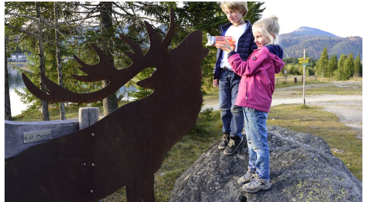
Isar-Natur-Erlebnisweg - © Alpenwelt Karwendel | Stefan Eisend