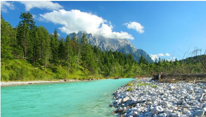
Isar bei Krün