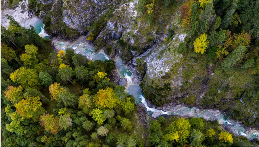
Herbstliche Finzbachklamm