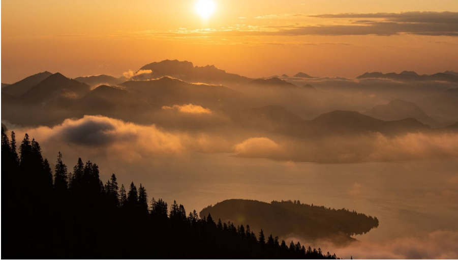
Sonnenaugang über den Simetsberg mit Blick auf den Walchensee