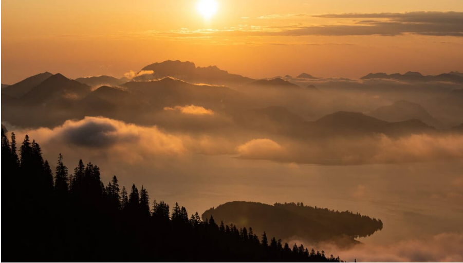
Sonnenaugang über den Simetsberg mit Blick auf den Walchensee