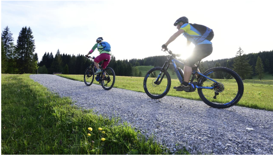
Morgenstunden in der Alpenwelt