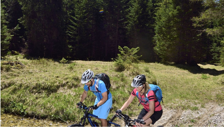
Moutainbiken in Bayerns Bergen