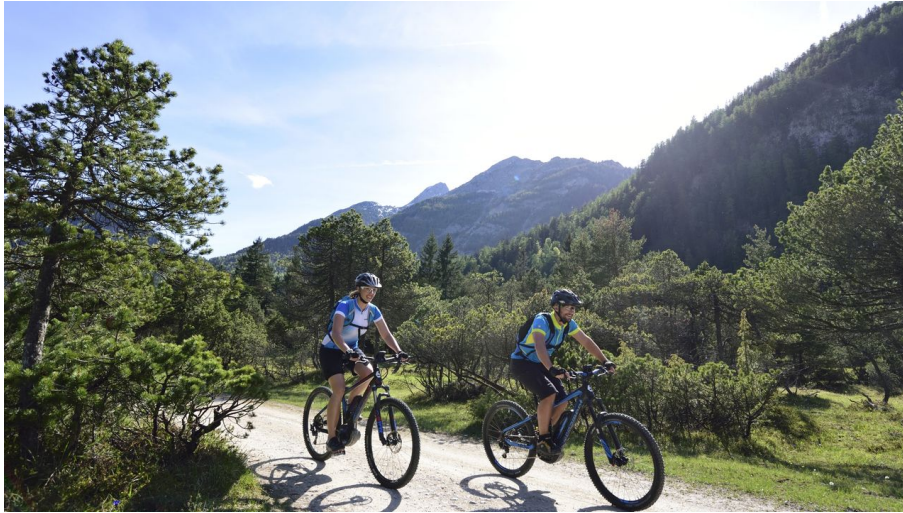
Tour Riedboden