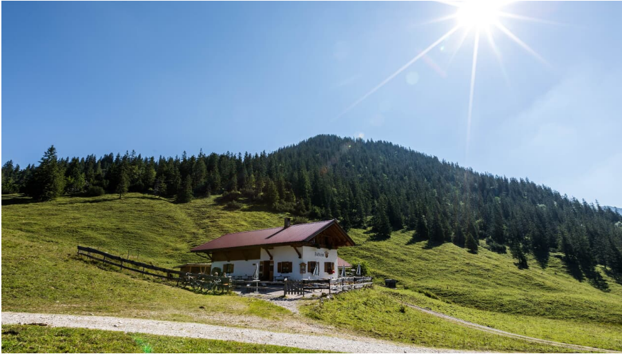
Fischbachalm - © Zugspitz Region GmbH | Erika Sprenghler, Erika Spengler / ulligunde.com