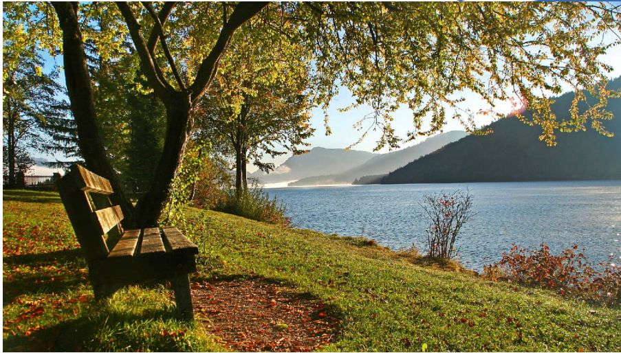
Ruhe genießen am Walchensee