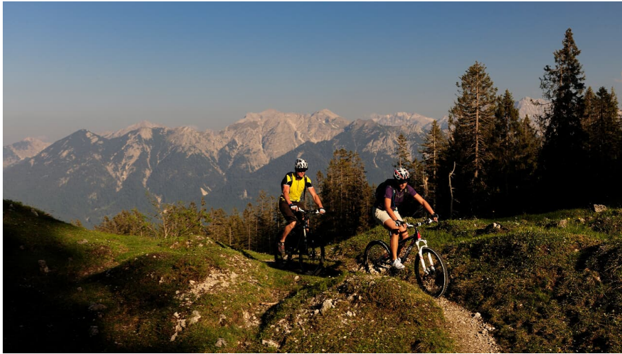
Mountainbiketour auf dem Singletrail