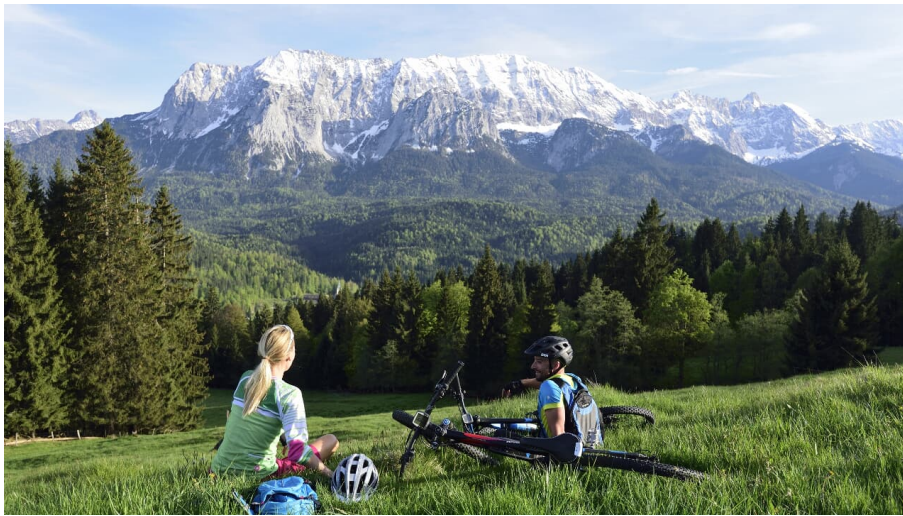
Rast mit schöner Aussicht