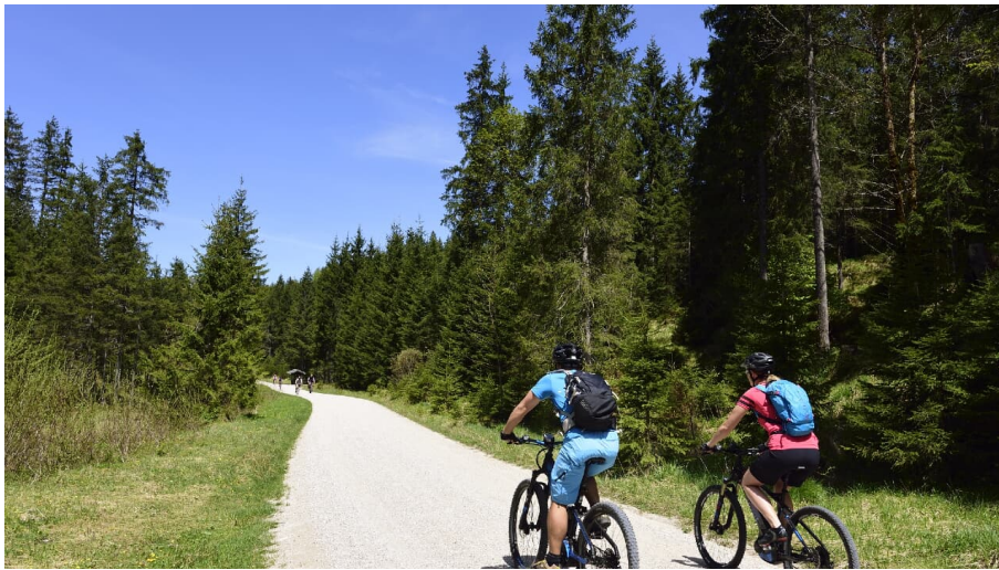
Mountainbiken in der Alpenwelt