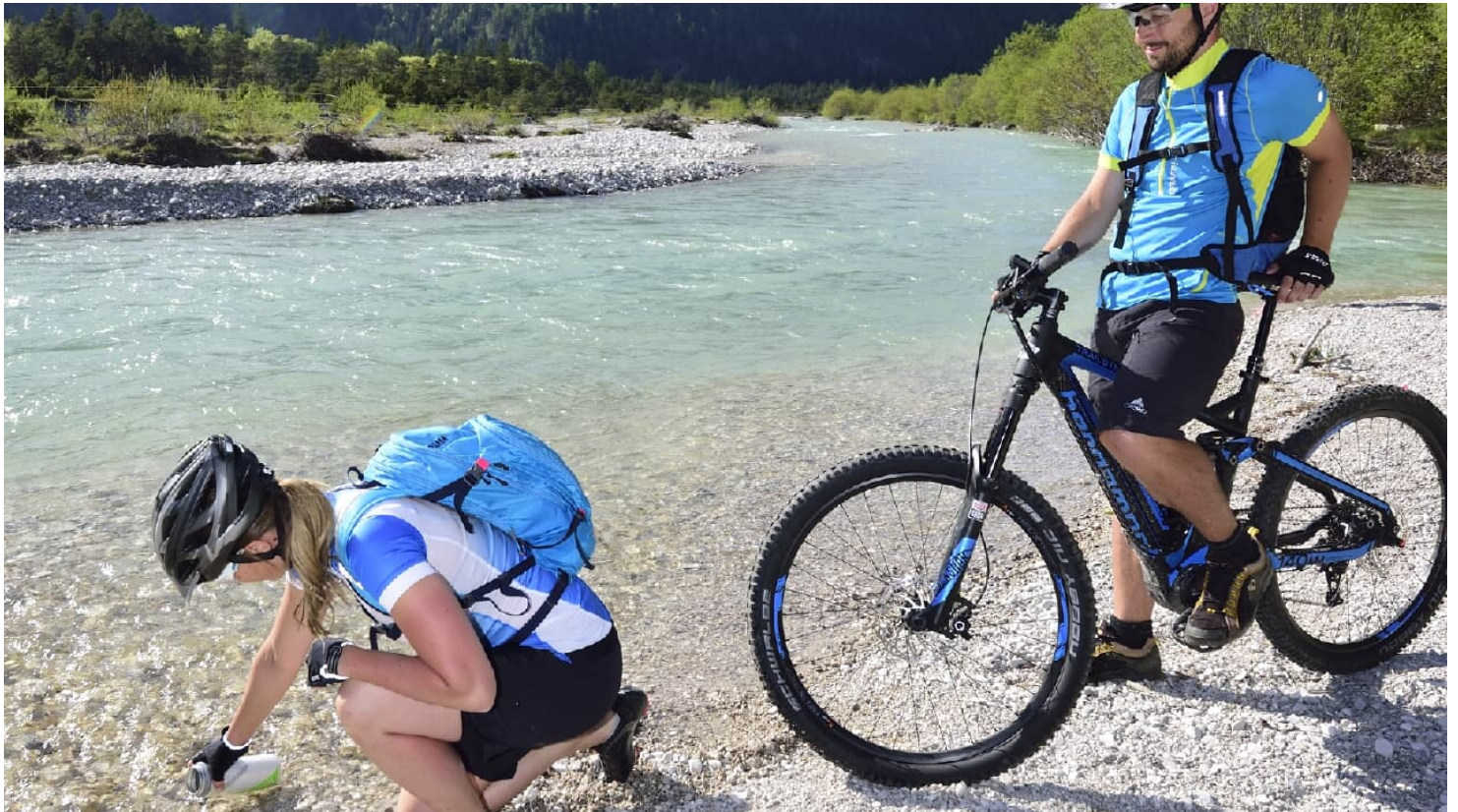
Pause an der Isar