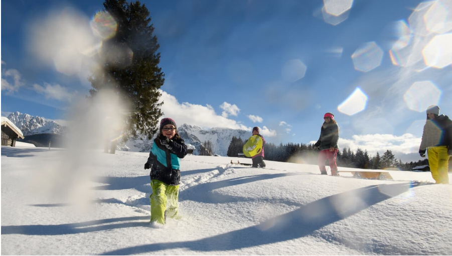
Winterwandern Buckelwiesen