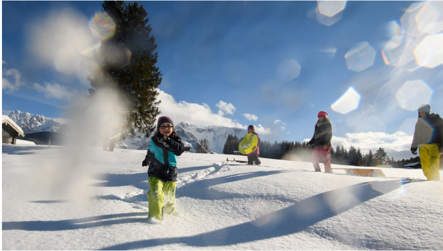
Winterwandern Buckelwiesen