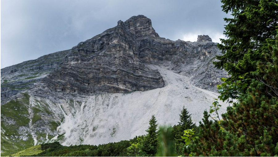
Soiernspitze von unten