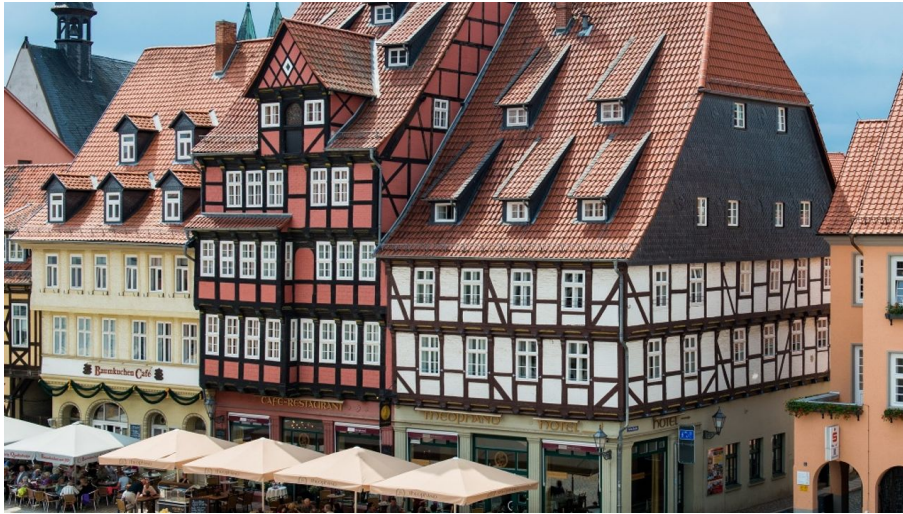
Hotel Theophano in Quedlinburg Außenansicht Marktseite