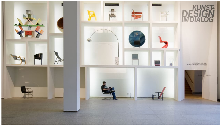
MAKK - © Maria Lucke - Maria Lucke