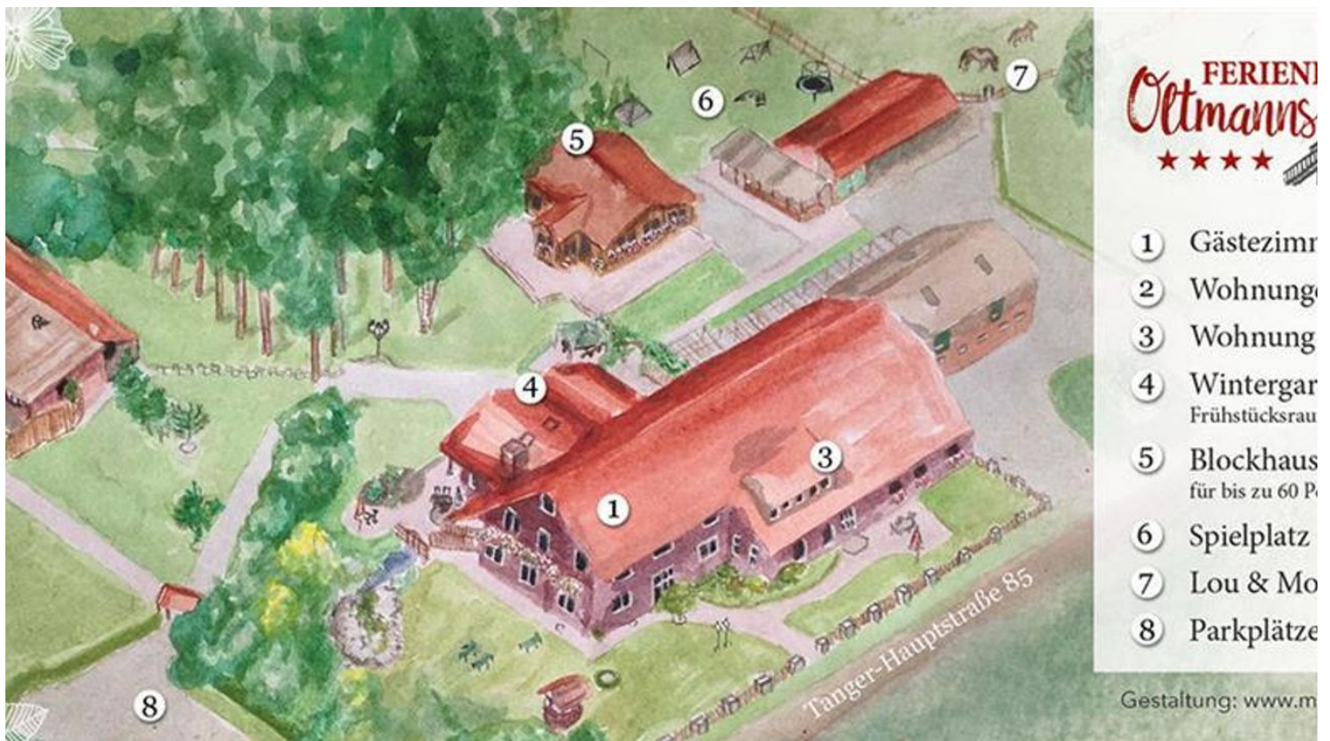
Lageplan - © Erika Oltmanns