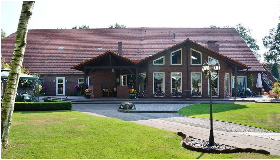
Außenansicht - © Erika Oltmanns