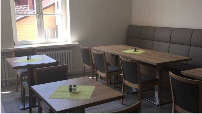
Hotel Fulda, Frühstücksraum