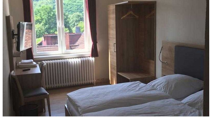
Hotel Fulda, Doppelzimmer