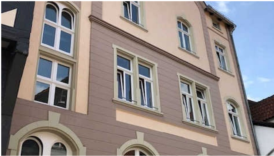
Hotel Fulda, Außenansicht