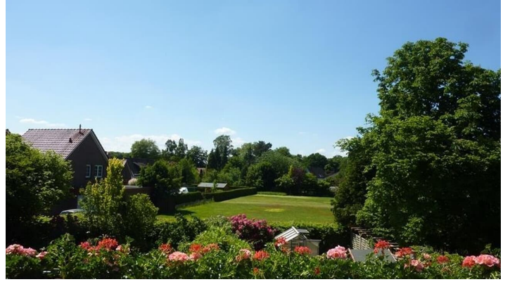
Blick in Garten