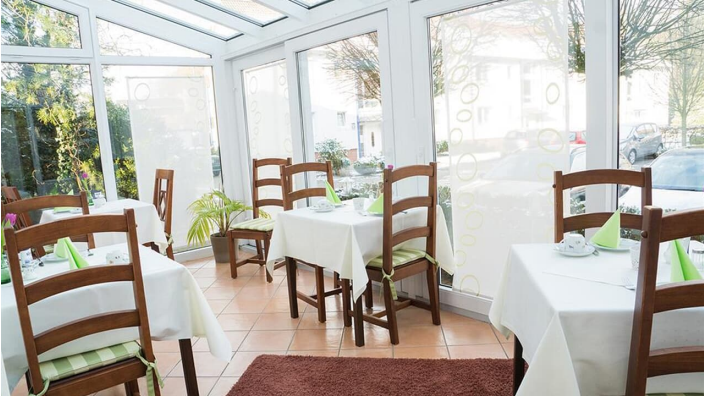
Frühstück im Wintergarten