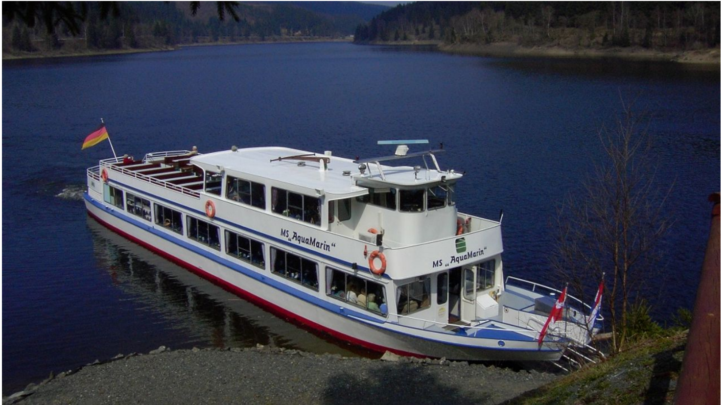
Schiffahrt auf dem Okerstausee