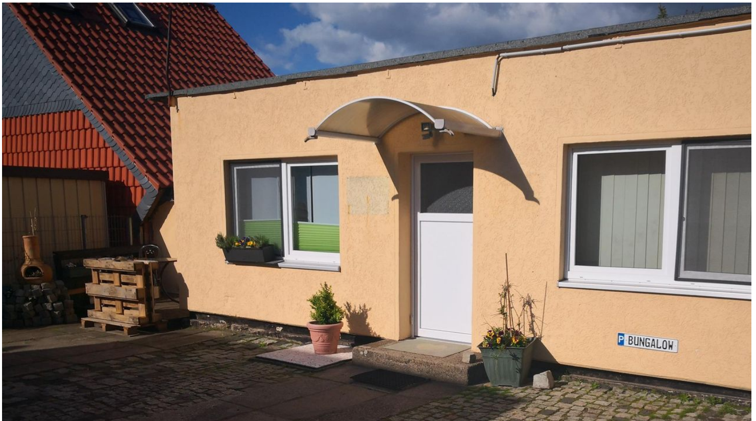
Bungalow mit Außensitzplatz