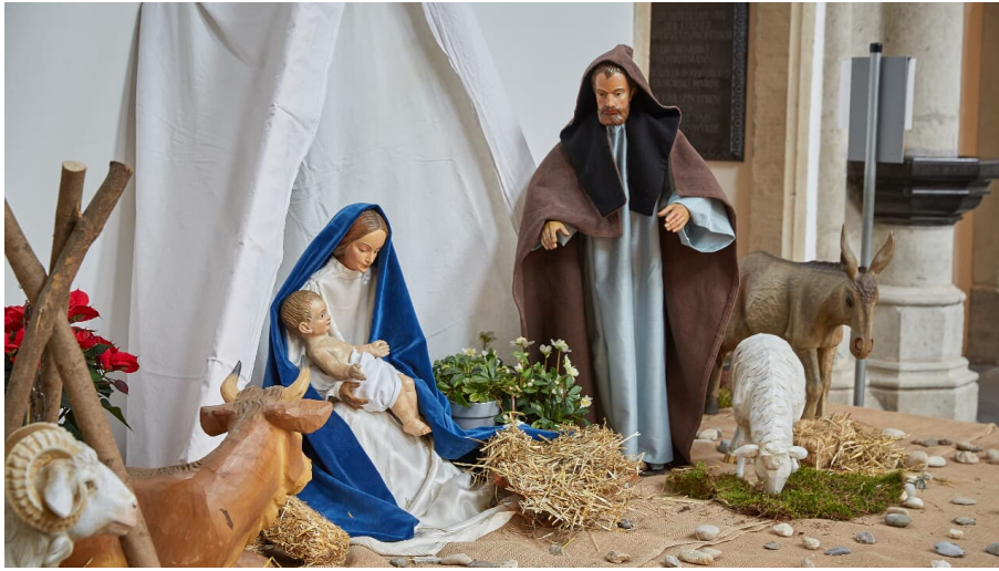
Axel Schulten - Axel Schulten