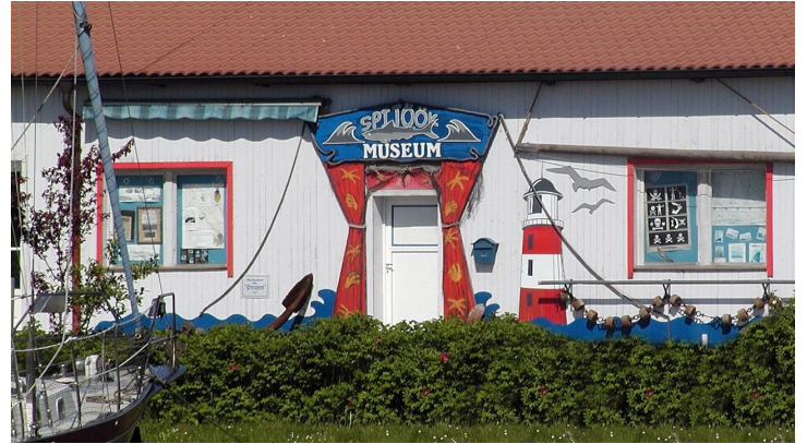
Spijöök Vareler Hafen