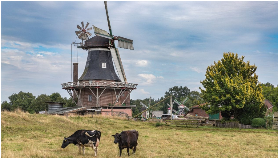
Die Rutteler Mühle an der Strecke