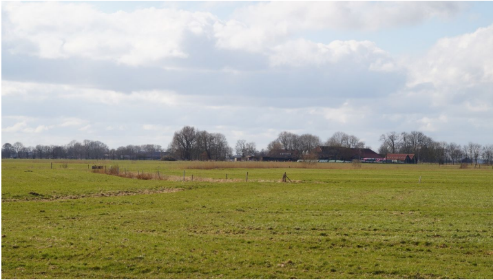
Felder und Höfe entlang der Strecke