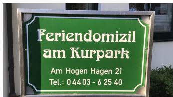
Adresse Ferienwohnungen Thoben