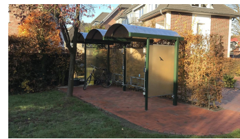
Fahrradstand mit Elektroanschluß