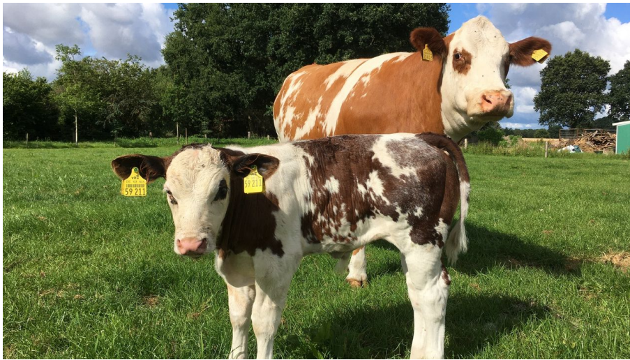
Mutterkühe Wemken