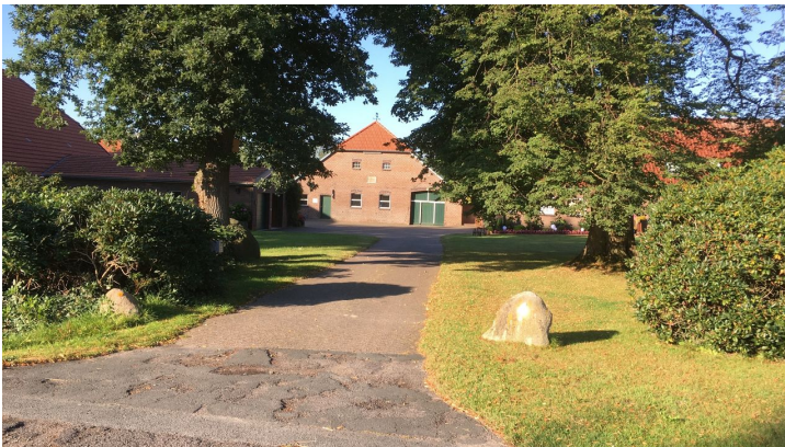
Hof Ahlers