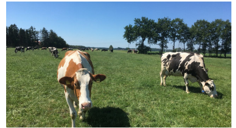
Kühe auf der Weide