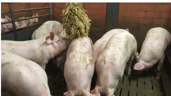
Mastschweine mit Stroh