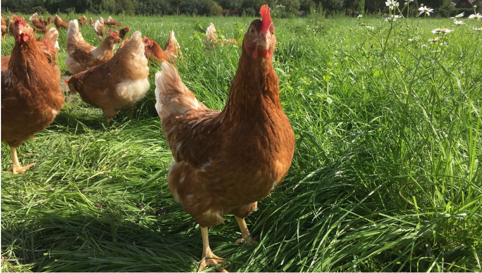
Freilaufende Hühner