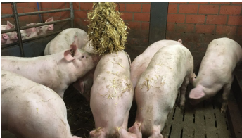
Mastschweine mit Stroh