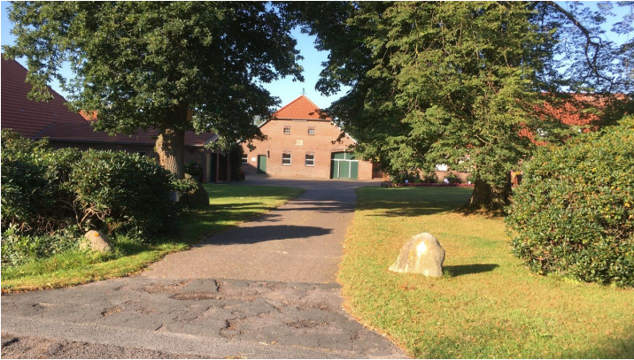
Hof Ahlers