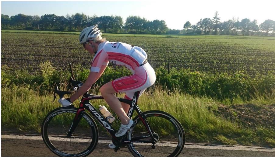
Unterwegs auf der großen Ammerlandrunde