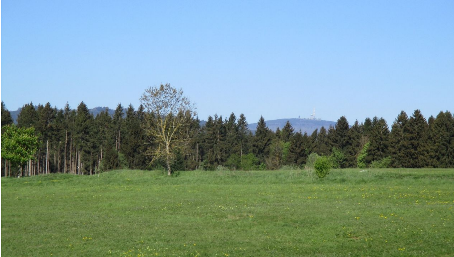
Ausblick von Elbingerode zum Hochharz