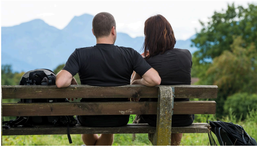
Wanderung zu den Lauschern