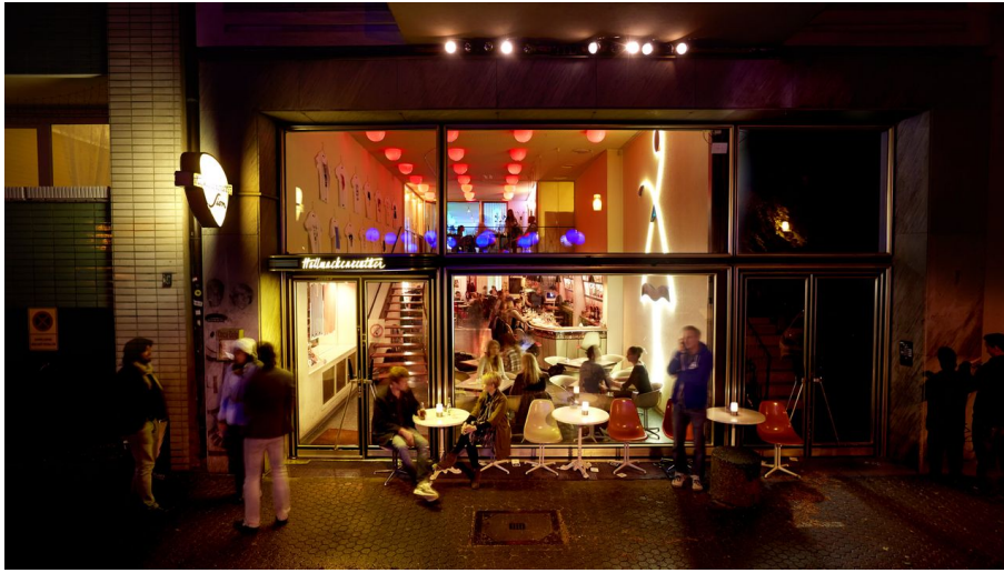
Durch die Nacht