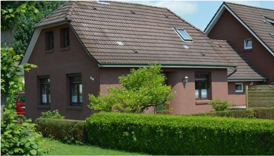
Aussenansicht Janßen