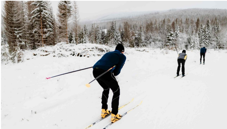
Skilanglauf in Schierke