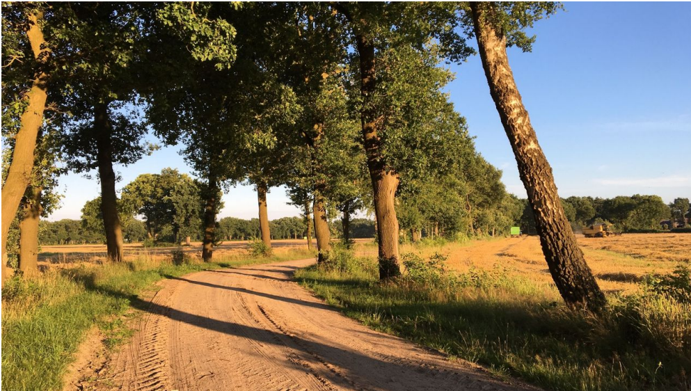
Ammerland Touristik, Ostfriesland Tourismus