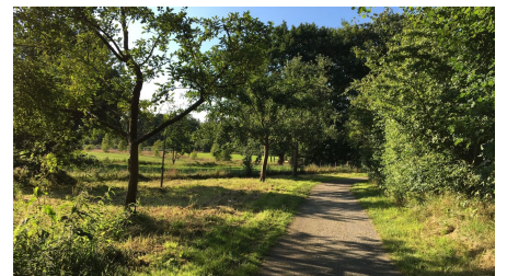
Ammerland Touristik, Ostfriesland Tourismus