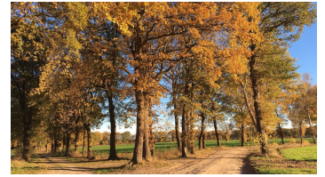
Marlis Puls, Ostfriesland Tourismus