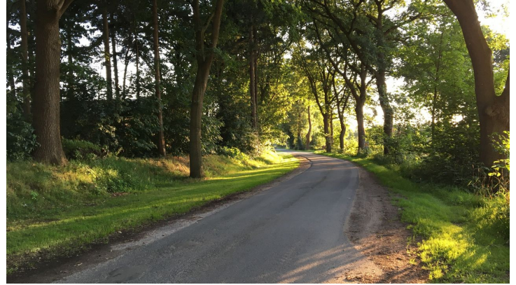
Ammerland Touristik, Ostfriesland Tourismus