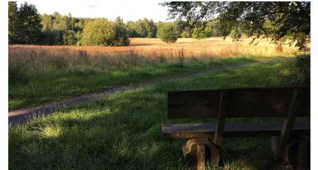
Ammerland Touristik, Ostfriesland Tourismus