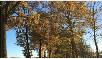
Marlis Puls, Ostfriesland Tourismus