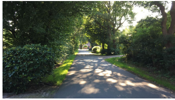
Ammerland Touristik, Ostfriesland Tourismus