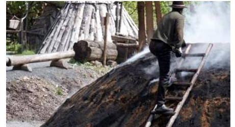
Harzköhlerei Stemberghaus - © Philine Hachmeister, Harz: Magische Gebirgswelt