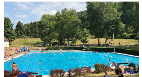
Bergschwimmbad Altenbrak