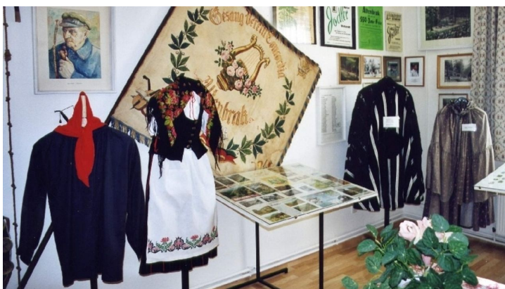
Harz: Magische Gebirgswelt