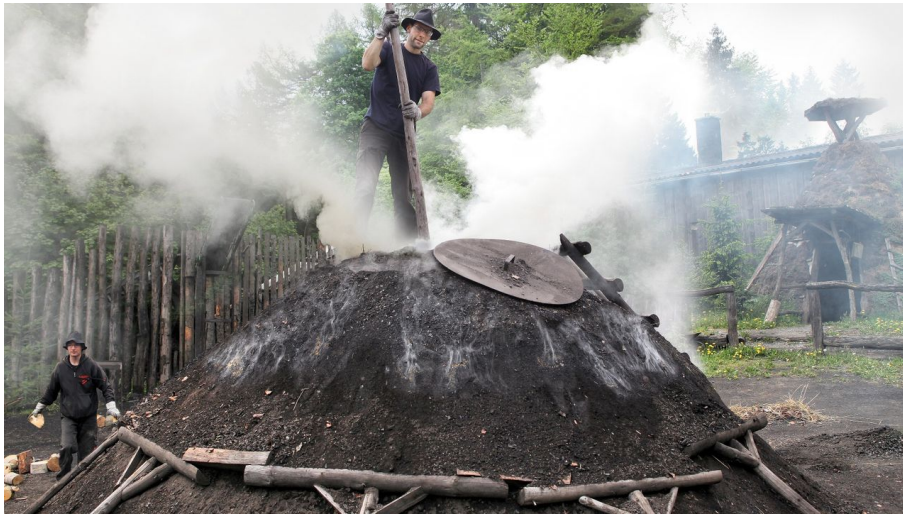
Harzköhlerlei Stemberghaus