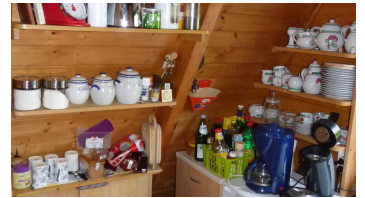
P1000148 - © Küche