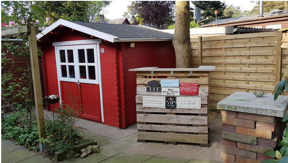
Conneforde-Garten mit Außentresen - © Schuppen für Gartenmöbel, Grill, Bollerwagen