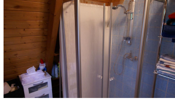
DSC07351 - © Bad mit Dusche