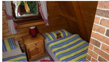
DSC07384 - © 2. Schlafzimmer