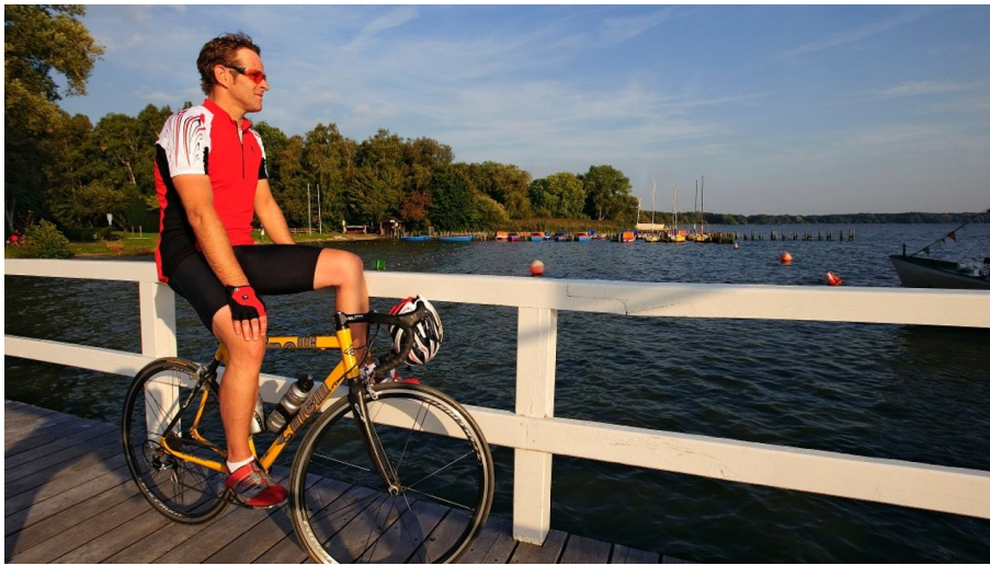
Pause am Nordufer des Zwischenahner Meeres