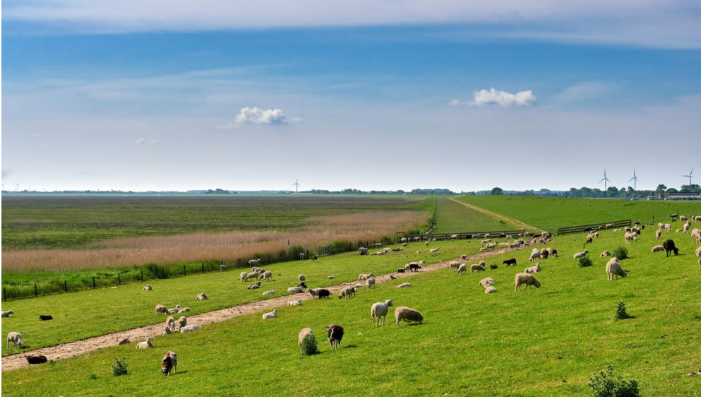
Schafe auf dem Deich