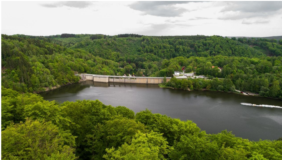
Informationszentrum Talsperre Wendefurth