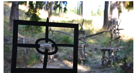
Harzer-Hexen-Stieg, Erlebnisinsel Thronkreis an der Königsburg