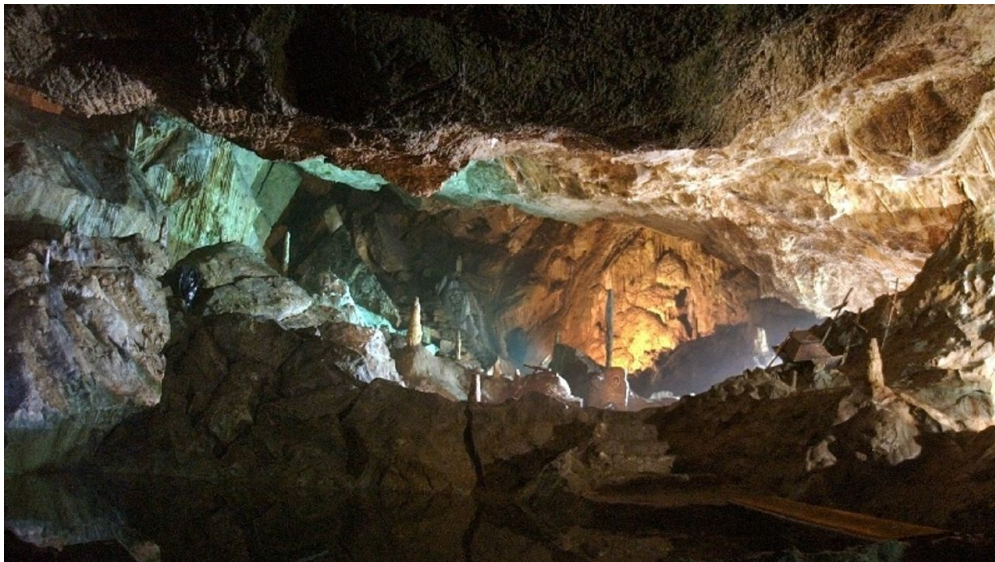
Goethesaal in der Baumannshöhle - © Harzer Tourismusverband, Harz: Magische Gebirgswelt