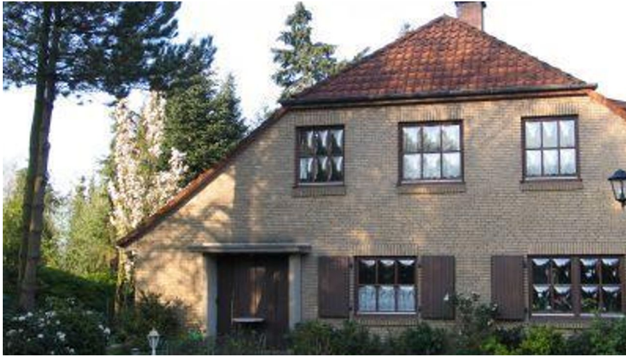
Außenansicht - © Anita Fischer