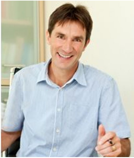
Eberhard Gross - © Eberhard Gross